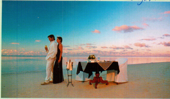
Das Team von „The Residence“ serviert Honeymoonern ein romantisches Strand-Dinner.